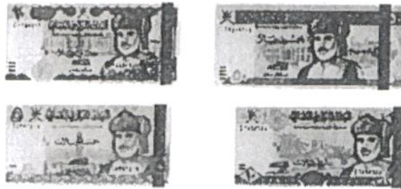
50 ريال عماني 2019م